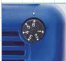
■コントロールダイヤル