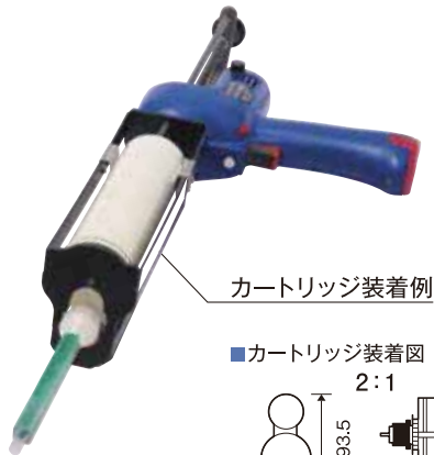
カートリッジ装着例