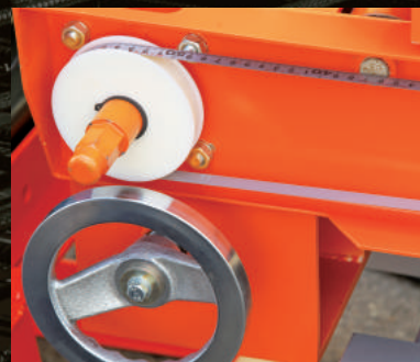
鉄筋寸法を手元で設定